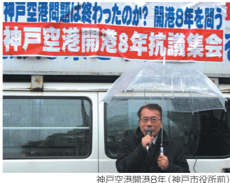
神戸空港開港8年(神戸市役所前)