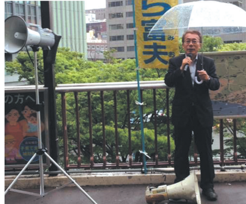
朝の演説 32年間欠かさず続けています