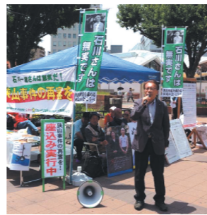
石川さんは無実です