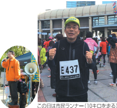
この日は市民ランナー(10キロを走る)