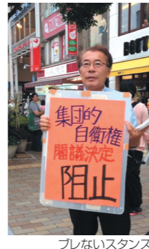
ブレないスタンス