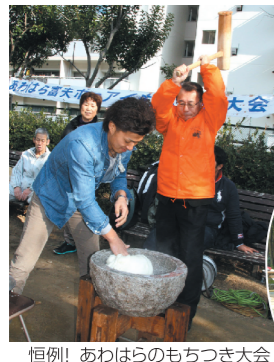
恒例! あわはらのもちつき大会